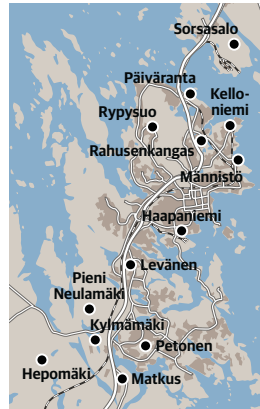
GRAFIikka: MIKKO PITKANEN LÄHDE: KUOPION KAUPUNKI