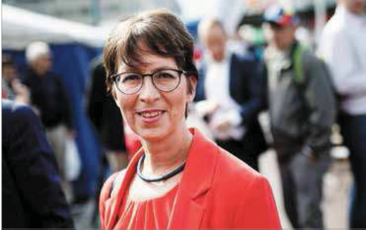
Sari Essayah (kd.) on sairauslomalla rintasyöpädiagnoosin takia.